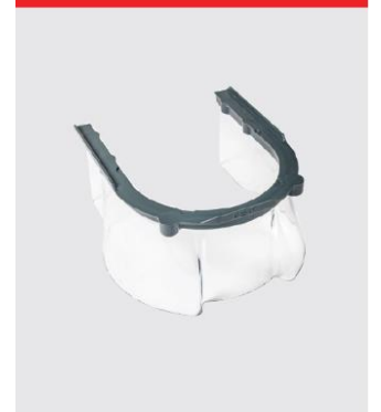
マグネット式 樹脂安全ガード