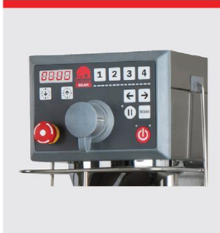
アタッチメントドライブ