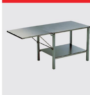
RN10用 ステンレス作業テーブル