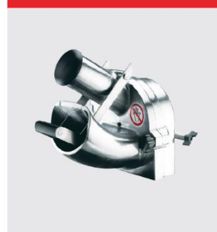
ベジタブルカッター-GR10