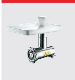
ミートミンサー (70 mm)